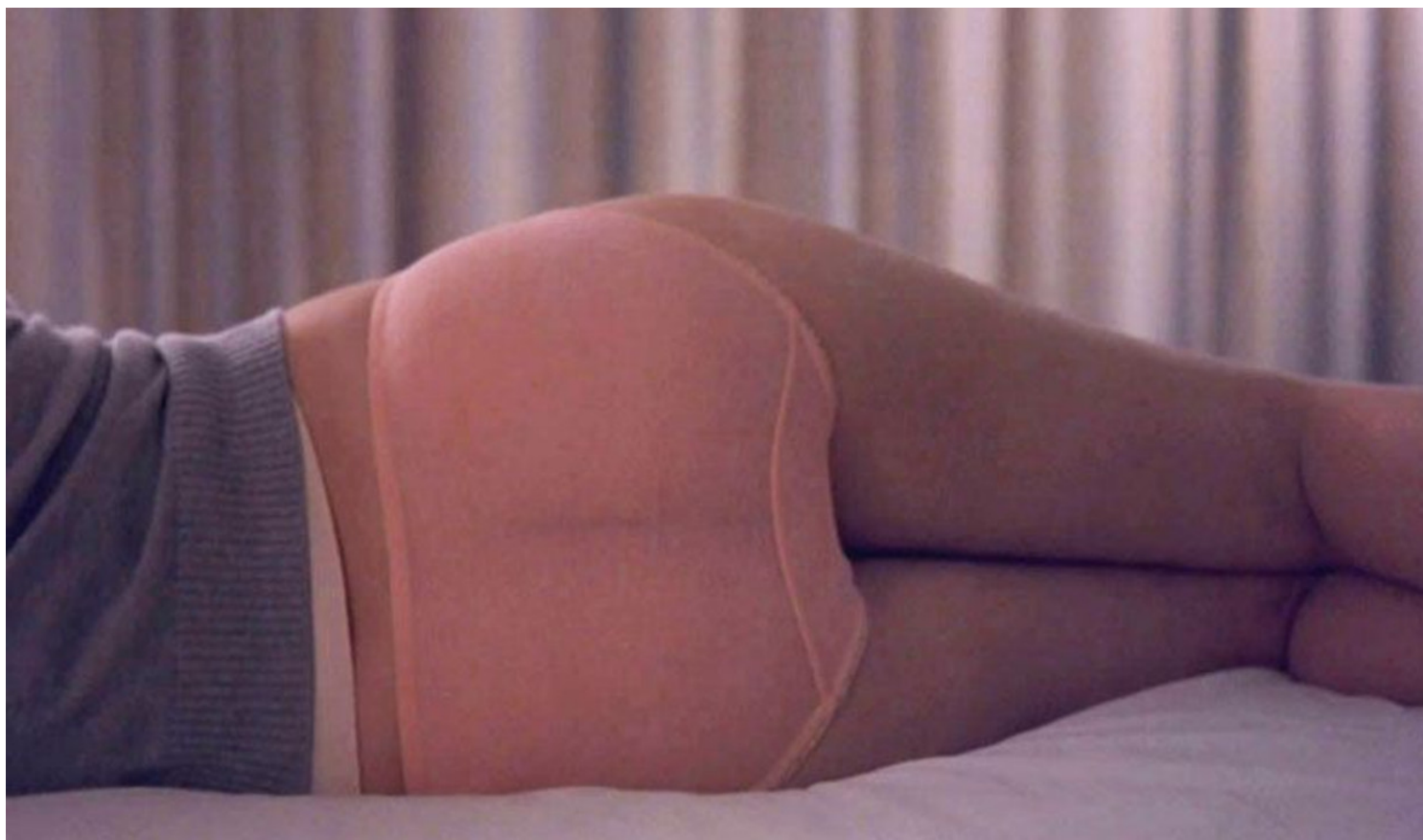
De billen van Scarlett Johansson in Lost in Translation.